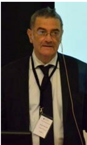
Figur 1. Nobelprisvinner Serge Haroche holdt konferansens første plenuseforedrag.

For første gang ble Nordic Physics Days arrangert i Norge, nærmere bestemt av Institutt for Fysikk ved Norges Teknisk Naturvitenskapelige Universitet (NTNU). Konferansen ble avholdt 9. – 12. juni og trakk nærmere 170 deltagere fra hele Norden.