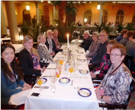
Figur 3. I godt selskap under festmiddagen i Palmehaven, Britannia Hotel.

Årsmøtet i Norsk Fysisk Selskap ble avholdt 11. juni om ettermiddag. I forventning om at Nordic Physics Days ville bli arrangert igjen i 2017 ble det besluttet å arrangere de store fysikermøtene i partalls år, slik at neste fysikermøte med valg av styre, samt prisutdelinger